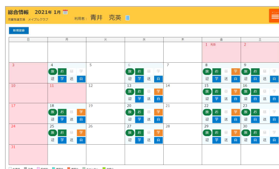
職員（従業員）が使うタブレット用施設版の総合情報画面