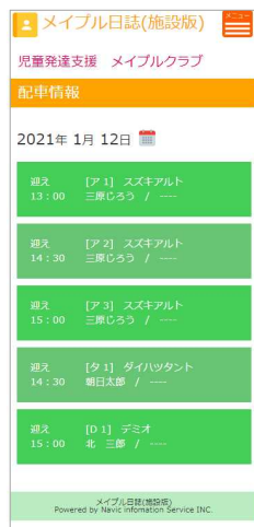
職員（従業員）が使う施設版のスマホ送迎配車画面