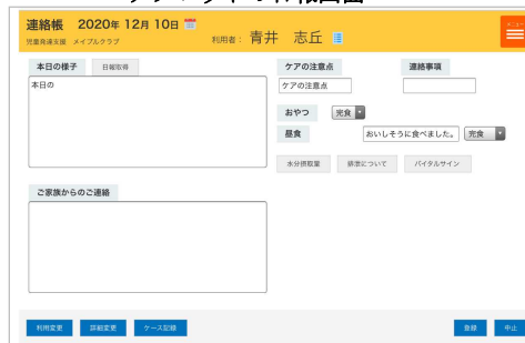
タブレットの日報画面

機動力に優れたタブレットで、現場で直観的に入力。タブレットとは言え、バイタルなども入力できます。