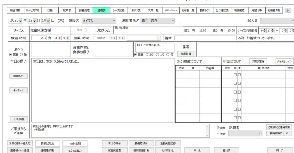
パソコンの日報画面

パソコン画面で、じっくり入力。またタブレットなどでメモ的に入力された内容に細かく加筆を行ったりして編集できます。