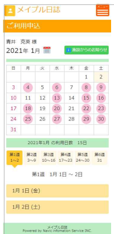
利用者（保護者）が使う利用者版のスマホ利用申込と連絡帳画面